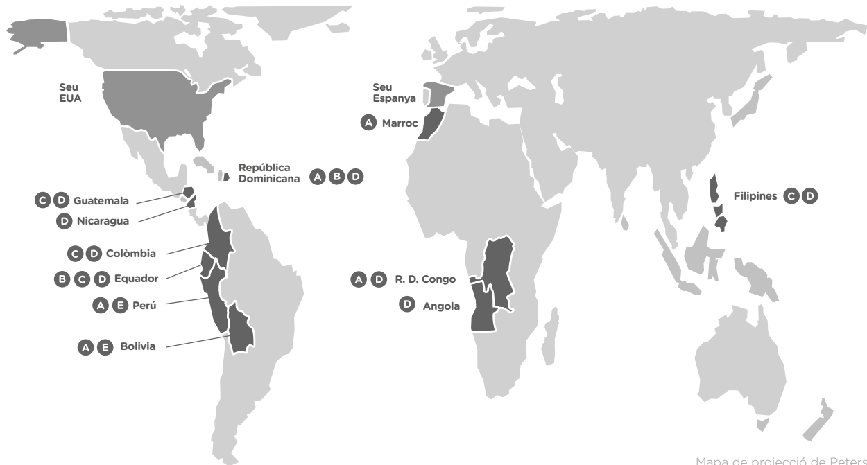
Mapa de projecció de Peters